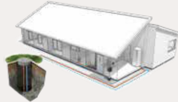
Wärmepumpe mit Tiefenbohrung