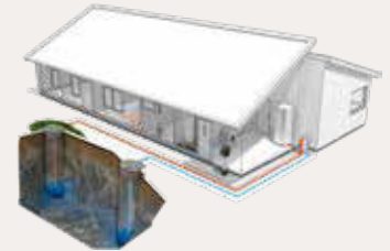
Wärmepumpe mit Grundwasser